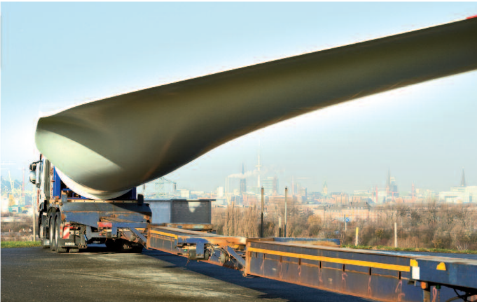
REpower Systems, Foto: Jan Oelker

Vor der Montage schicken Hersteller die Rotorblätter zum Testen ins Fraunhofer-Institut für Windenergie und Energiesystemtechnik (IWES) nach Bremerhaven.