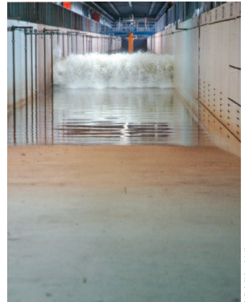
Leibniz Universität Hannover

Vor der Montage schicken Hersteller die Rotorblätter zum Testen ins Fraunhofer-Institut für Windenergie und Energiesystemtechnik (IWES) nach Bremerhaven.