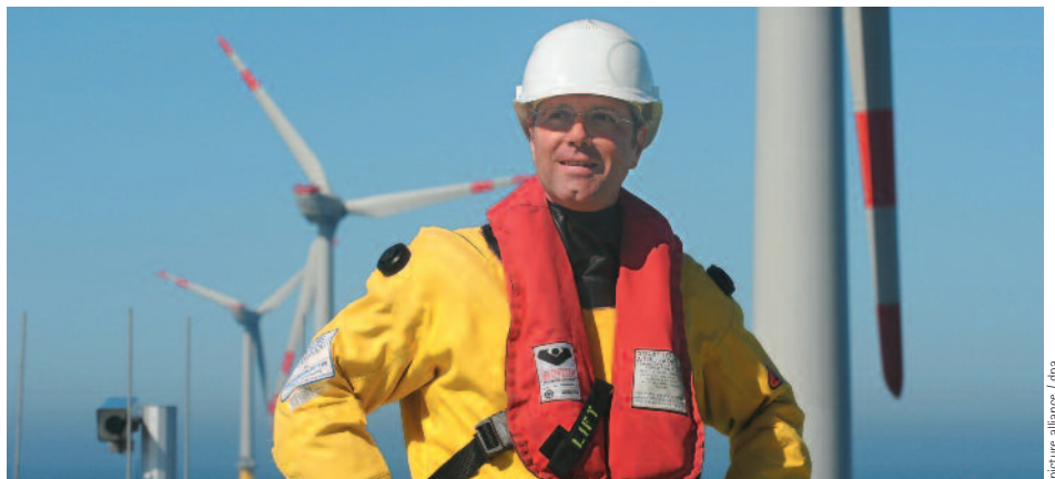
Bundesumweltminister Norbert Röttgen (CDU) präsentiert sich als Wegbereiter der Energiewende – doch es fehlen die Taten, meint unser Gastkommentator Franz Alt.