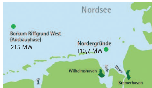
Offshore-Planungen der EnergieKontor-Gruppe

Ein weiteres wichtiges Segment für das Unternehmen ist die Planung und Entwicklung von Offshore-Projekten. Vorrangig zu nennen sind hier zwei Windparks in der deutschen Nordsee. Im Offshore-Windpark Nordergründe, der in der Jade-/Wesermündung liegt, sollen 18 Anlagen der 6-Megawatt-Klasse innerhalb der 12-Seemeilen-Zone errichtet werden. Die Baugenehmigung für dieses Projekt wurde im Oktober 2011 erteilt. Darüber hinaus wird die Planung für den Windpark Borkum Riffgrund West II (Ausbauphase) mit 43 Windkraftanlagen in der sogenannten Ausschließlichen Wirtschaftszone weiter verfolgt.