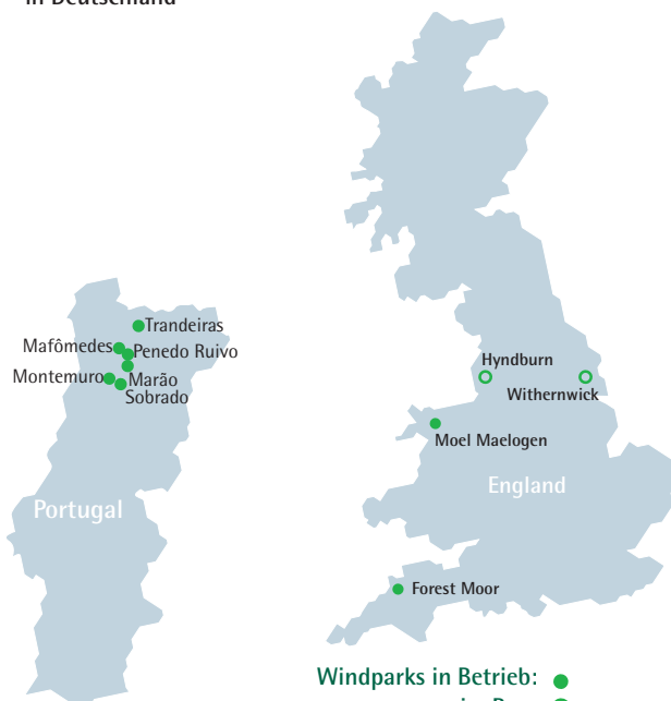
in Portugal und Großbritannien