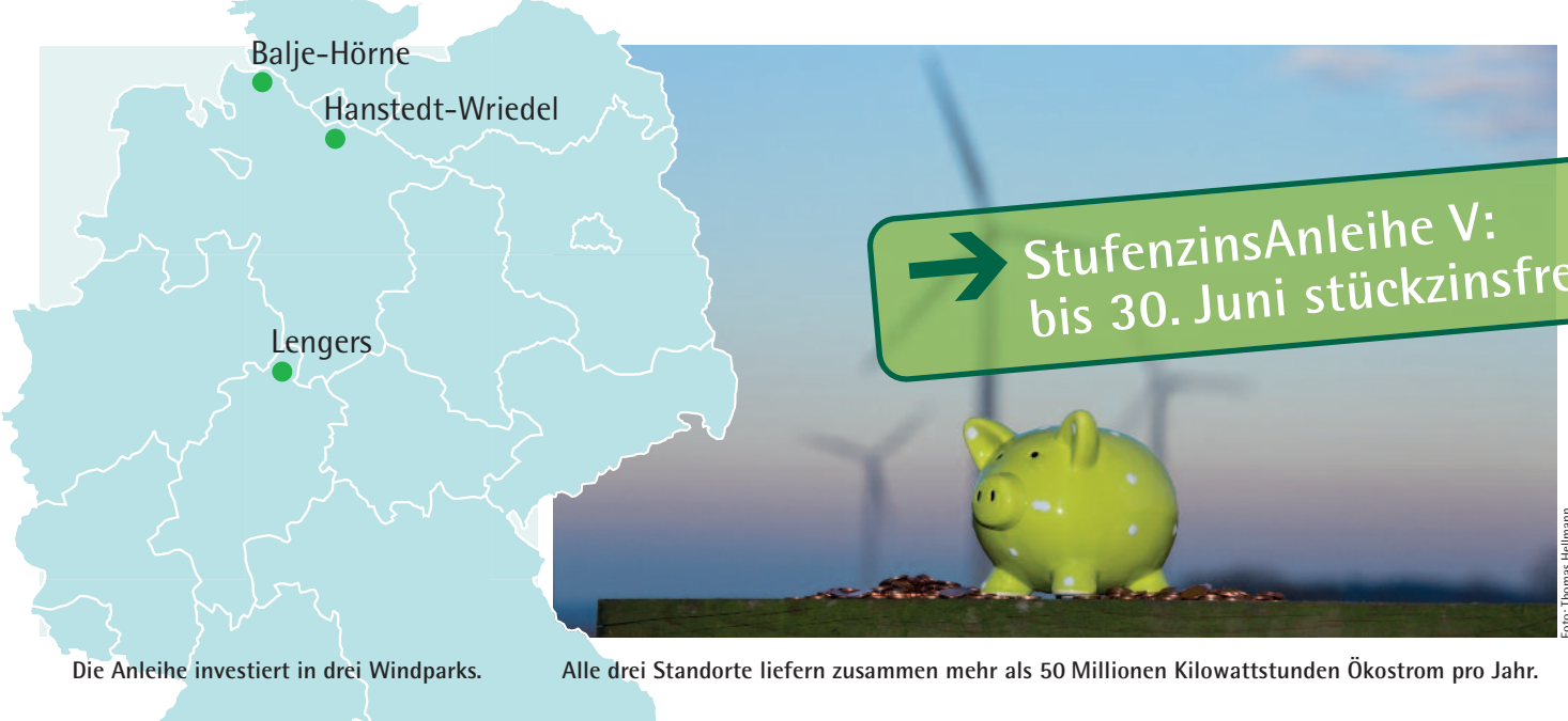
Die Anleihe investiert in drei Windparks.

Mit der StufenzinsAnleihe V bietet Energiekontor ein flexibles Investment mit viel Windstrom und festen Zinsstufen bis zu 6,5 Prozent