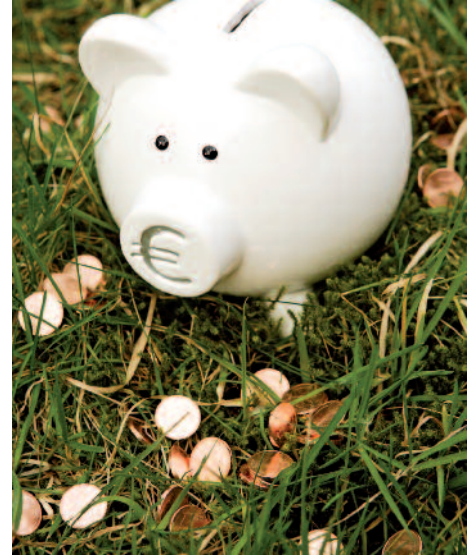
In ganz Europa befindet sich der grüne Anlagemarkt im Aufwind.

Wissen Sie eigentlich, was Ihr Geld auf der Bank gerade macht? Arbeitet es als Darlehen für die Rüstungsindustrie? Finanziert es Kernkraftwerke oder steckt es in spekulativen Börsengeschäften? Seitdem die Schuldenkrise Europa in den Griff bekommen hat, hinterfragen offenbar immer mehr Menschen das Wirtschaften ihrer Bank. Entsprechend groß ist das Interesse an nachhaltigen Geldanlagen. Das verdeutlichte zuletzt eine Studie des europäischen Branchenverbandes Eurosif vom Herbst 2012. Demnach ist das Vermögen, das in Europa unter sozialen, ökologischen oder ethischen Kriterien verwaltet wird, von 2009 bis 2011 von 5 auf 6,7 Billionen Euro gestiegen – eine Zunahme um 34 Prozent.