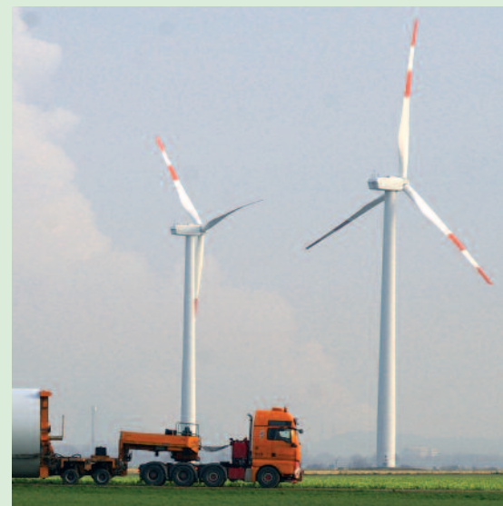
Seit Anfang des Jahres liefert der Windpark Titz klimaneutralen Strom für NRW.

Vor allem für die Reduktion der Treibhausgase ist der Windstrom von Bedeutung. Schließlich hat sich NRW Anfang des Jahres als erstes Bundesland zur Emissionsminderung verpflichtet. »Das Klimaschutzgesetz gibt uns die Ziele vor«, erklärt Umweltminister Johannes Remmel. Bis 2020 sollen die Emissionen um 25 Prozent sinken, bis 2050 um 80 Prozent gegenüber 1990. Nun gehe es darum, die notwendigen Schritte festzulegen.