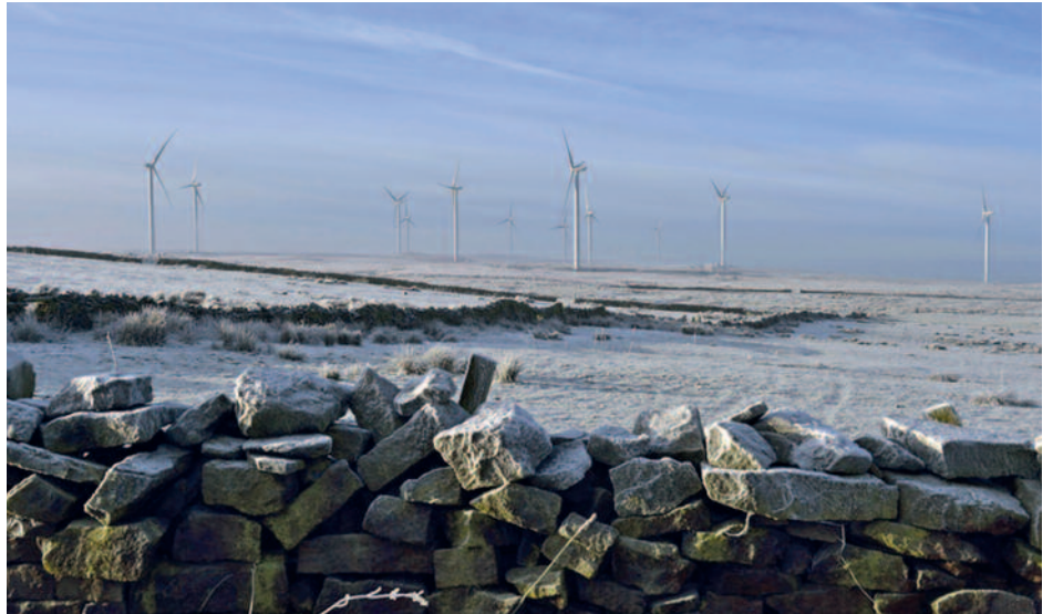
Beim Windpark Hyndburn rechnet Energiekontor mit 78 Millionen Kilowattstunden Windstrom im Jahr. Das reicht aus, um den Bedarf von 20.000 Haushalten zu decken.

Acht Windräder mit einer Gesamtleistung von 18,5 Megawatt sollen sich bald auch in Withernwick drehen. Der Standort befindet sich in der Grafschaft Yorkshire, wo schon seit ein paar Monaten kräftig gebaut wird. Die Inbetriebnahme der Anlagen dürfte in Kürze erfolgen. Withernwick gehört wie Hyndburn zu den konzernerneigenen Windparks von Ener-