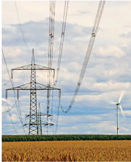
Zuverlässige Einspeiseprognosen sind für die Stabilität des Stromnetzes wichtig.

Weil die Leistung von Photovoltaik und Windkraft schwankt, sind Einspeiseprognosen wichtig. Die Erträge der kommenden 24 Stunden lassen sich heute bereits mit einer Wahrscheinlichkeit von etwa 90 Prozent berechnen. Um bestehende Modelle weiter zu optimieren, haben der Deutsche Wetterdienst (DWD) und das Fraunhofer-Institut für Windenergie und Energiesystemtechnik (IWES) jetzt ein neues Forschungsprojekt gestartet. Erstmals sollen dort die Ertragsdaten von Windkraft- und Photovoltaikanlagen in die Wettermodelle des DWD einfließen. Ziel ist es unter anderem, die Modelle des DWD besser an die Belange der Energiewirtschaft anzupassen. Vor allem die Genauigkeit kurzfristiger Einspeiseprognosen dürfte dadurch noch weiter steigen. Als Partner sind die Übertragungsnetzbetreiber 50 Hertz, Amprion und TenneT an dem Projekt beteiligt.