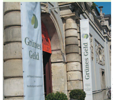
Die Verbrauchermesse »Grünes Geld« informiert über nachhaltige Kapitalanlagen.

Sicher, nachhaltig und rentabel: Über Finanzprodukte, die diese Anforderungen erfüllen, können sich Anleger regelmäßig auf der Messe »Grünes Geld« informieren. Sie findet in verschiedenen deutschen Städten statt. Energiekontor ist das nächste Mal am 13. April 2013 in München dabei und berät dort über Windkraft-Beteiligungen. Veranstaltungsort ist das Künstlerhaus am Lenbachplatz. Der Eintritt ist kostenfrei. Weitere Infos: www.gruenes-geld.de