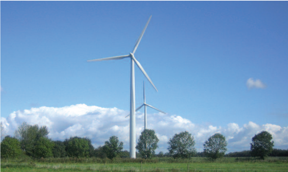
Der Schutz von Klima und Umwelt ist den Deutschen besonders wichtig. So hatten 2012 bereits 12 Prozent der Bundesbürger Geld in erneuerbare Energien investiert.

Sie investieren in soziale Projekte, Umwelttechnik oder erneuerbare Energien: Nachhaltige Investments haben Prinzipien – und sie liegen damit im Trend