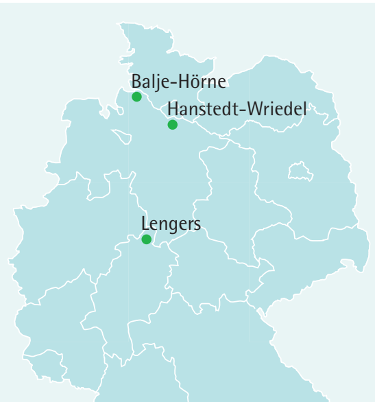
Drei schuldenfreie Windparks stellen das ökologische Investment auf sichere Füße.

Der Klassiker von Energiekontor bietet feste Zinsstufen ab 6 Prozent, hohe Flexibilität und ein erstrangiges Sicherheitspaket für Anleger