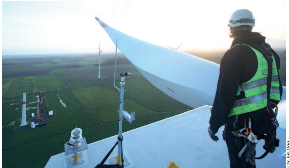
Nach der Reaktorkatastrophe in Fukushima haben viele Bundesländer neue Flächen für Windräder ausgewiesen