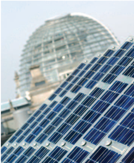
Die Kraft der Sonne wird auch im Regierungsviertel genutzt