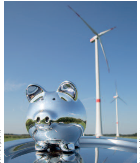
Die Kalkulation der zukünftigen Winderträge basiert auf fundierten, realen Werten

Das Geld der Anleger vergibt EnergieKontor als Darlehen an die Betreiber der Windparks. Diese verpfänden die Parks zugunsten der Emittentin, indem sie ihr die Kommanditanteile abtreten