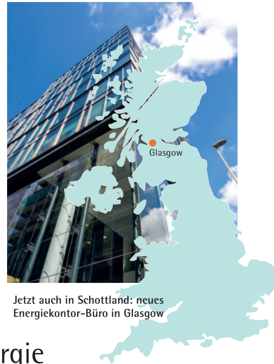
Jetzt auch in Schottland: neues Energiekontor-Büro in Glasgow